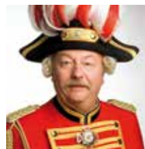
Pascal Stein Artilleriefeldzeichen